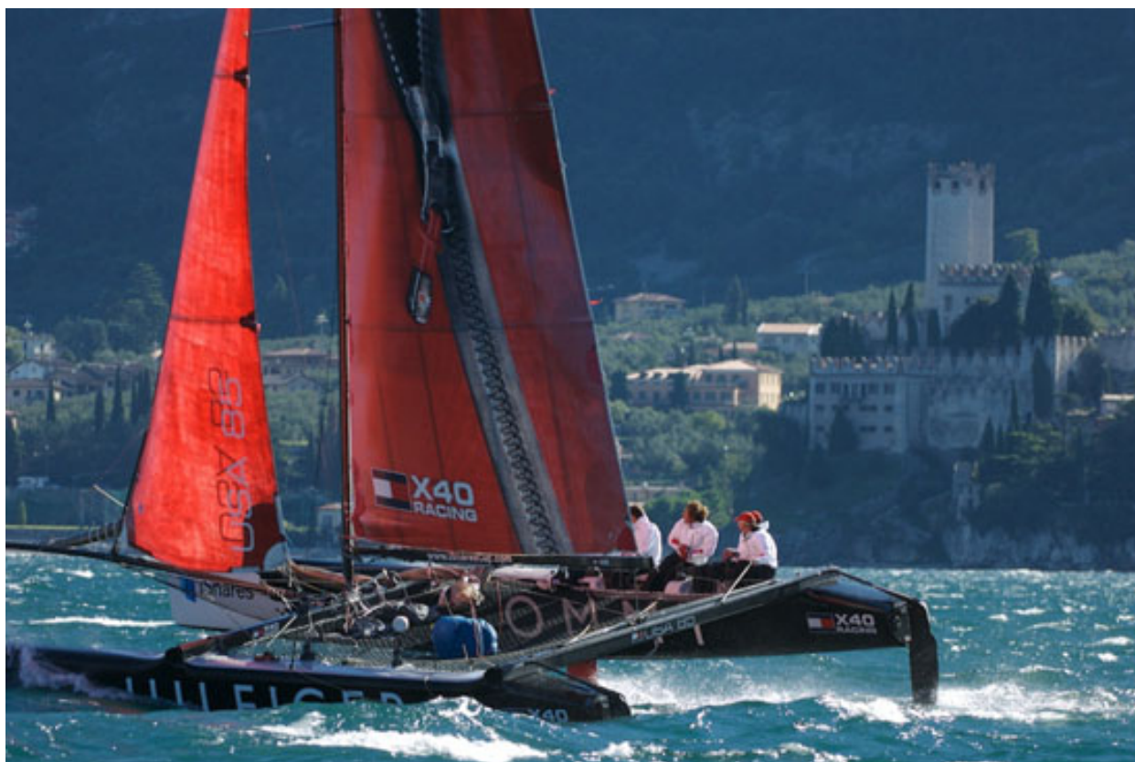
Figura 1 – Meteorologia, Sport e “Performance”: quali connessioni?

E' noto come le attività sportive, che vengono svolte all'aria aperta, siano fortemente influenzate dalle condizioni meteorologiche ed idrologiche con un forte impatto sull'economia del sistema. Inoltre la rapida evoluzione delle condizioni meteorologiche, che in alcuni casi può manifestarsi durante lo svolgimento di un'attività ludico-sportiva o di un evento sportivo, potrebbe addirittura interessare la salvaguardia della vita degli atleti (Pezzoli et al., 1997).